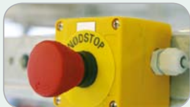
HORSE-TRAINER WALK är utrustad med 3 nödstoppknappar.