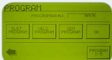
Programmering av upp till 100 individuella program