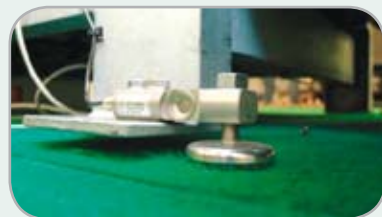
Kan utrustas med vägningsceller med minne