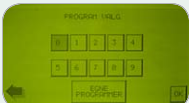
Maskinen är förprogrammerad med 10 fasta program