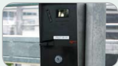
Kan levereras med myntbox