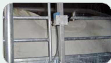
Fallskyddet kan ställas in från 135 till 175 cm.