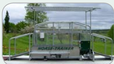
Kan förses med underhållsfritt tak