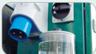
HORSE-TRAINER finns även för enfasström 240 VAC +N+PE - 32 A

HORSE-TRAINER WALK är otroligt driftsäker. Maskinen är helgalvaniserad, något som gör den motståndskraftig mot regn, snö och dåligt väder. HORSE-TRAINER är mycket enkel att underhålla. Vi har träningsmaskiner installerade hos tränare i Nordsverige där vintrar med snö och temperaturer ner till -25^{\circ}\text{C} är vardagsmat, och i Dubai med torka, damm, sol och temperaturer på över 45^{\circ}\text{C} . HORSE-TRAINER fungerar varje dag även under dessa förhållanden. Maskinerna är installerade utomhus endast utrustade med det underhållsfria taket till HORSE-TRAINER, vilket gör denna lösning enkel och utrymmesbesparande.